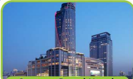
Centara Grand Hotel